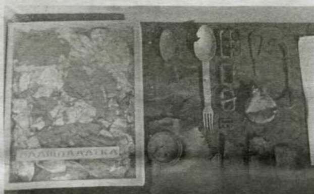
Подлинные предметы обмундирования и быта солдат.

воспроизведён путь полка с господствующей высотой 242 именно в районе нынешнего техникума. Полк с 5 июля по 5 августа 1943 года освобождал сёла Быковку, Ольховку, Яковлево, Триречное, Бутово, Луханино, Раково, Завидовку и т.д.